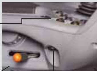
Gruppe gears kontakt